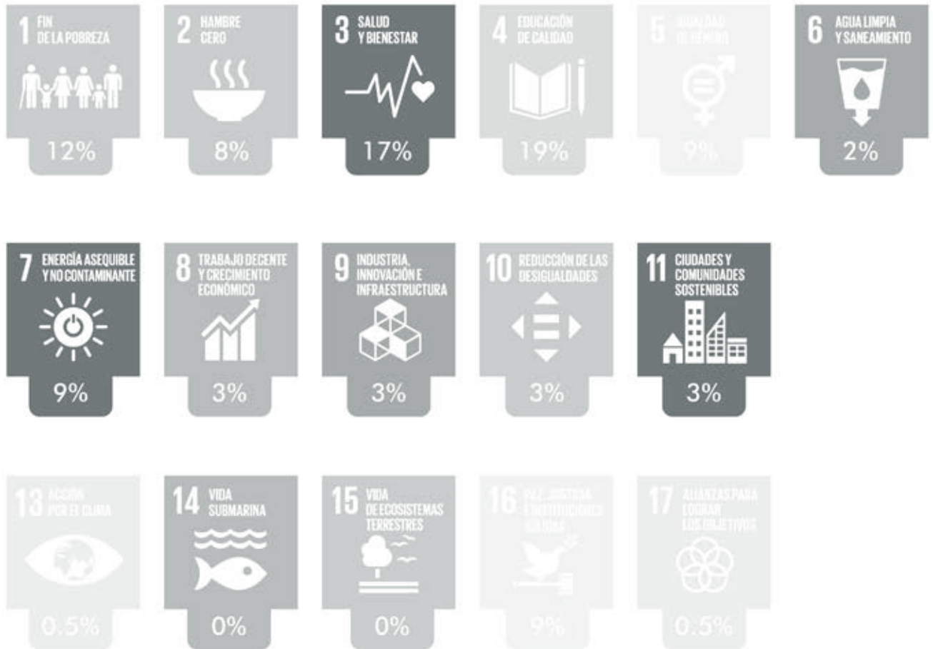
Gráfico 1 / El aporte de las OSC en Antioquia a los ODS.